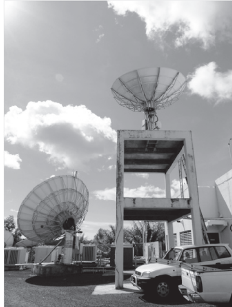
図3 パラオの衛星アンテナ (2010年8月)