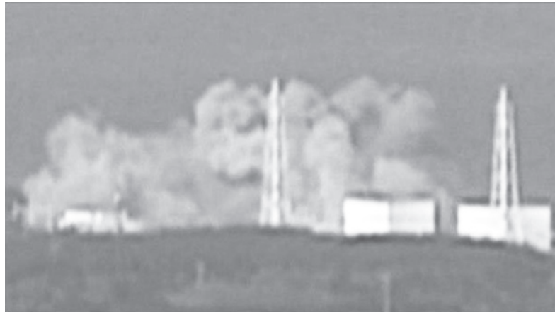
図1 福島第一原子力発電所の水素爆発, 2011年3月12日